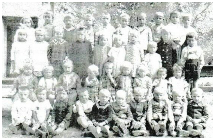
Kinderschüler um 1930

Der Verein sorgte für Wohnung, Lebensmittel, Licht und Brennmaterial und entrichtete pro Schwester pro Monat 20,- Mark an das Mutterhaus.